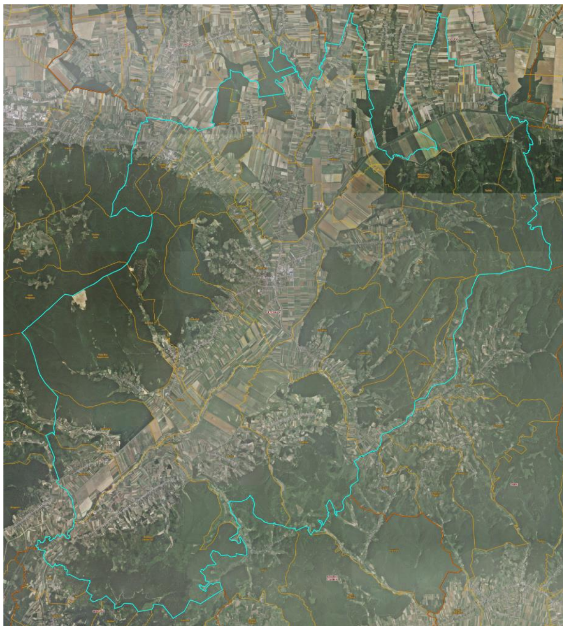
Slika 1: Naselja Grada Pleternice

Grad Pleternica prostire se na površini od 198,13 km 2 i sastoji se od 38 naselja: Ašikovci, Bilice, Blacko, Brđani, Bresnica, Brodski Drenovac, Bučje, Buk, Bzenica, Ćosinac, Frkljevci, Gradac, Kadanovci, Kalinić, Knežci, Komorica, Koprivnica, Kuzmica, Lakušija, Mali Bilač, Mihaljevići, Novoselci, Pleternica, Pleternički Mihaljevci, Poloje, Ratkovicica, Resnik, Sesvete, Srednje Selo, Sulkovci, Svilna, Trapari, Tulnik, Vesela, Viškovci, Vrčin Dol, Zagrađe i Zarilac., prikazanih na slici 1.